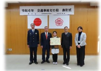
交通事故ゼロ校表彰式

保護者・地域の皆様、今年度も本校の教育活動へ多大なる御理解・御協力を賜り大変ありがとうございました。先日の2月13日(木)に、「令和6年交通事故ゼロ校表彰式」が幸手市役所で実施されました。日ごろ、保護者、防犯パトロールボランティアの方々をはじめ、地域の皆様の御支援のもと、交通事故なく生活することができ、御陰様で表彰を受けることができました。今後も、権小に通う一人一人の児童が「この学校で学べてよかった」と誇りに思える学校を創造していきたいと思えます。