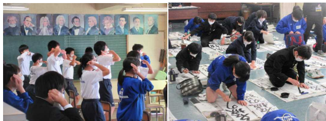
▲ 音楽（発声） ▲ 国語（書き初め）