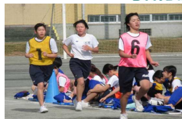
▲ 体育（持久走） ▼ 道徳（話合い）