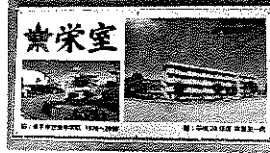
←平成20年度卒業記念品 栄室プレート 幸手中学校内に掲額いたします。