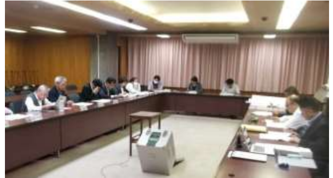
令和7年10月16日 会議の様子